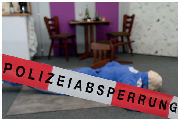
An unserem Tatort sehen Sie, wie die Beamten der Kriminaltechnik arbeiten.