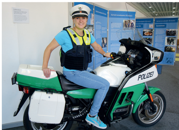
Probieren Sie selbst, wie es sich auf einem Polizeimotorrad sitzt. Selfies ausdrücklich erwünscht!

E-Mail: polizeiausstellung.dortmund@polizei.nrw.de