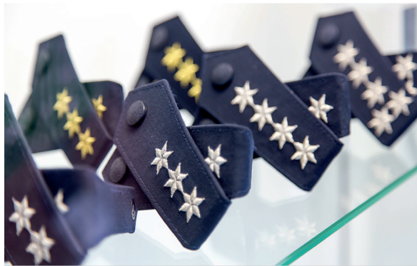
Jede Menge Sterne - Sie wollten schon immer mal wissen, was sie bedeuten? Wir erklären es Ihnen.

Wir möchten Ihnen die Vielfältigkeit der Polizeiarbeit transparent machen - einmal abseits von Film und Fernsehen.